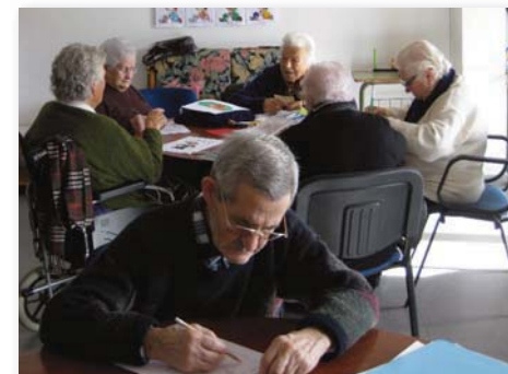
Usuarios del Aula de Respiro

El Ayuntamiento de Villar del Arzobispo tenía adjudicadas 10 plazas, pero debido al éxito de este programa se han ampliado a 14 plazas, estando todas cubiertas