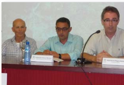
Presentación del libro de Plantas

Además, el Ayuntamiento ofrece becas a los alumnos matriculados en Educación infantil.